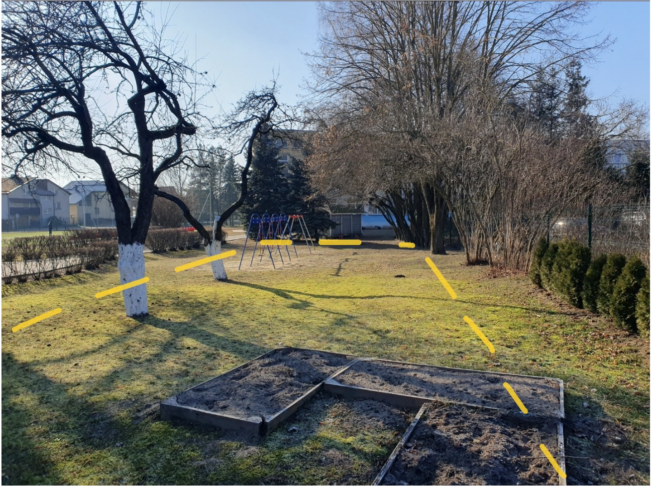
Fotonuotrauka Nr. 2 Projektuojamo statinio – kompleksinių paslaugų centro vaikams, Atgimimo g. 8A, Kazlų Rūdoje , statybos vieta pažymėtas geltona punktyrine linija. Vaizdas iš šiaurės rytinės sklypo pusės.