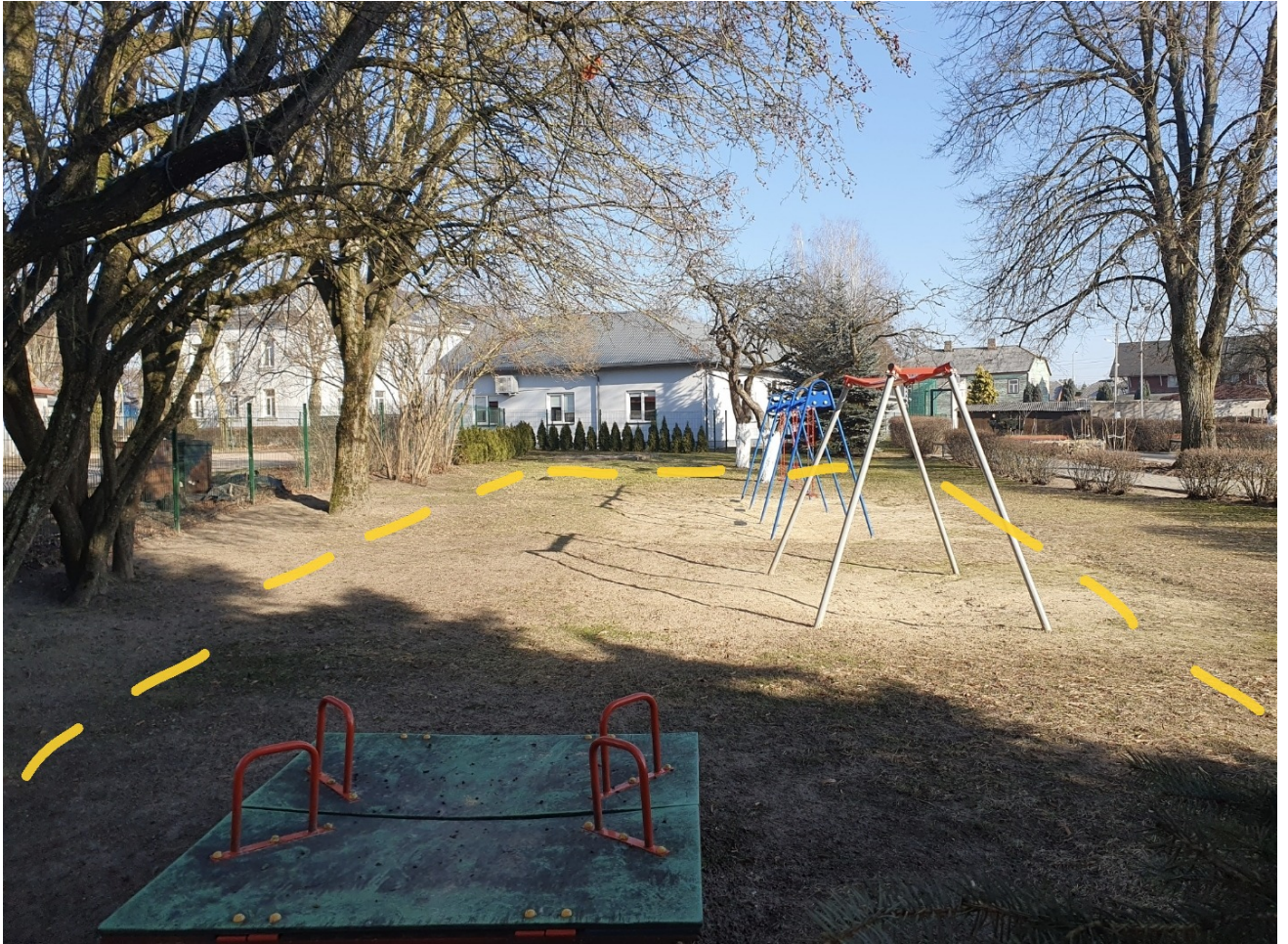
Fotonuotrauka Nr. 1 Projektuojamo statinio – kompleksinių paslaugų centro vaikams, Atgimimo g. 8A, Kazlų Rūdoje , statybos vieta pažymėtas geltona punktyrine linija . Vaizdas iš pietvakarinės sklypo pusės.